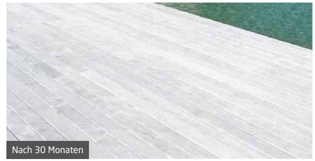
Der Boden in Oesingen wurde direkt nach Installation (links), nach 10 Monaten (Mitte) und nach 30 Monaten (rechts) fotografiert.