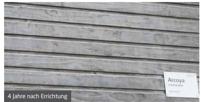
Ein Teil der nach Südfassade wurde im April 2010 mit Accoya® verkleidet und seitdem nicht gepflegt. Die Bilder zeigen die Fassade Im Juli 2010, 2012, 2014 (von links nach rechts).