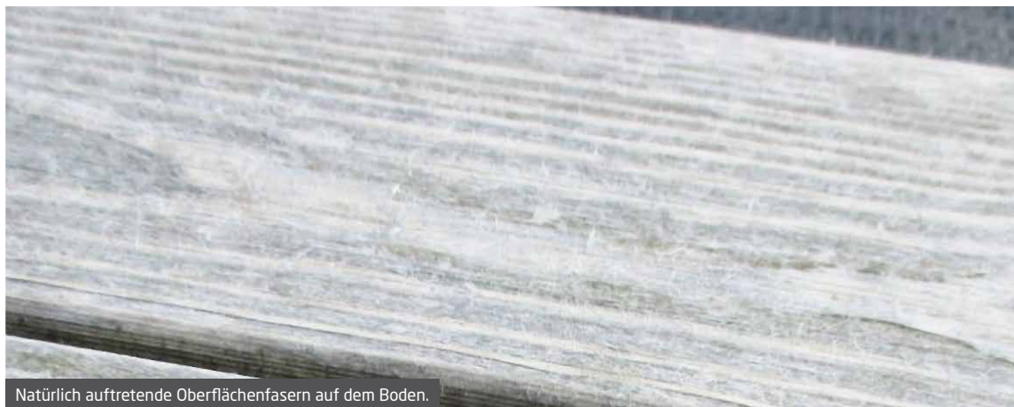
Natürlich auftretende Oberflächenfasern auf dem Boden.

Je höher die Menge oder die Intensität der UV-Oberfläche ist, desto schneller entwickelt sich dieser Prozess. Es ist anzumerken, dass diese Fasern auf allen exponierten Holzarten, einschließlich Accoya®, insbesondere auf flachen Oberflächen, wie Böden gebildet werden. Ein geripptes Bodenprofil neigt dazu, diese Fasern anzusammeln, was es umso auffälliger macht.